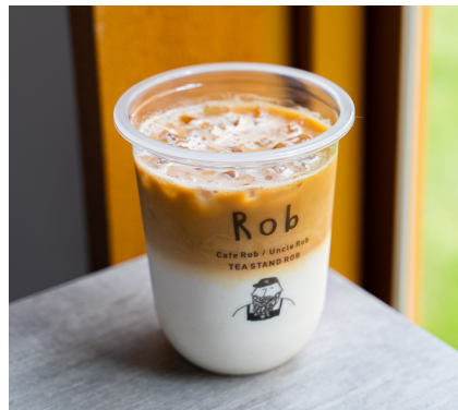
カフェラテ (Ice/Hot) M572 S462