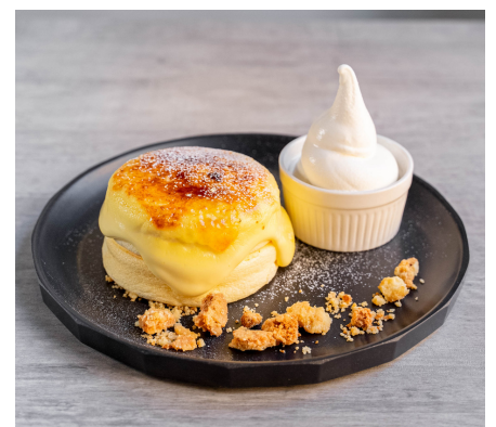
クリームブリュレパンケーキ 1375