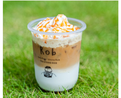
キャラメルマキアート (Ice/Hot) M660 S506