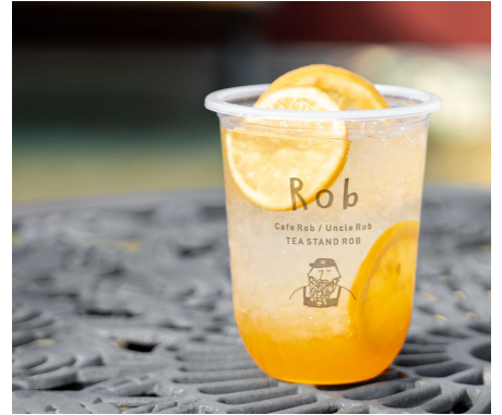
ハニーレモネード M605 S550