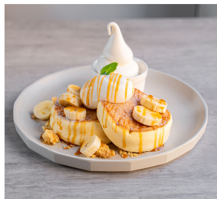
キャラメルorチョコバナナパンケーキ 1375