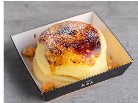
クリームブリュレケーキ 880