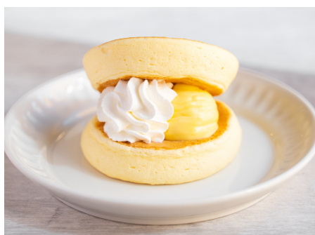
パンどらカスタード 462