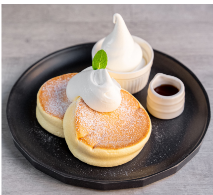
プレーンパンケーキ 1100

そう思い台湾夜市と同じ鉄板を輸入し、日本に初めて台湾パンケーキを持ち込みました。