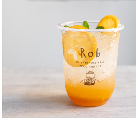
ハニーレモンスカッシュ M715 S638