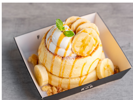
キャラメルorチョコバナナケーキ 825