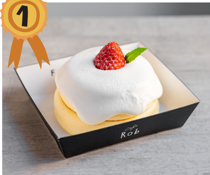
苺のホールケーキ 880