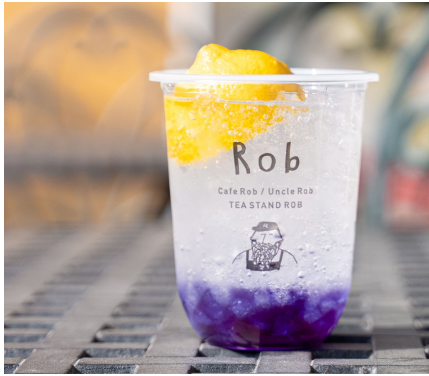
レモンマンゴーソーダ 715