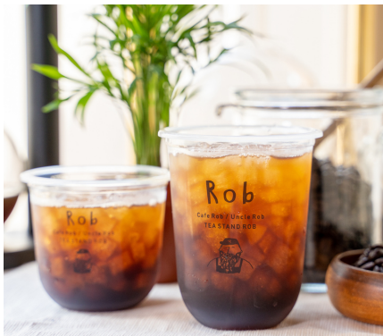
ロブブレンド Ice M460 S380 Hot M506 S380